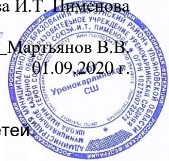
ГРАФИК ПРОВЕДЕНИЯ ДЕГУСТАЦИЙ общественной комиссией по контролю за питанием детей на 2020-2021 учебный год